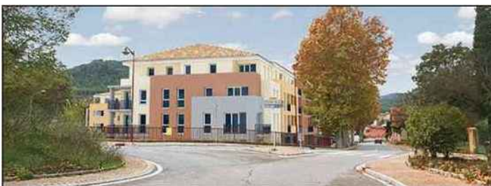
Le projet du 11 boulevard de la Libération.